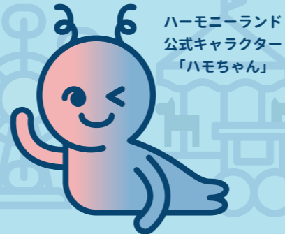
ハーモニーランド 公式キャラクター 「ハモちゃん」

多様な「現実」を信仰しているハモ人（はもじん）たちが時に楽しく、時に苦しく暮らすハーモニーランドに一緒に迷い込んでみよう!